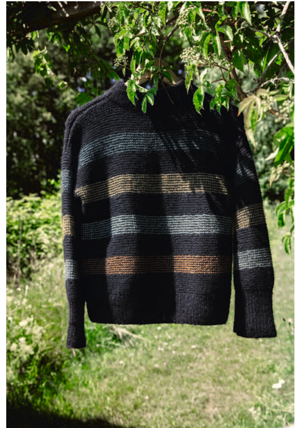
2013 | ALPAKKA SILKE | \times 4 | \frac{\text{AAA}}{17 | 110} | • FAUNA GENSER 2 | TYNN SILK MOHAIR | XS-XXXL (nedenfra og opp)