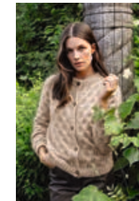
SNØKLOKKE JAKKE Tynn Silk Mohair x3 Design 4