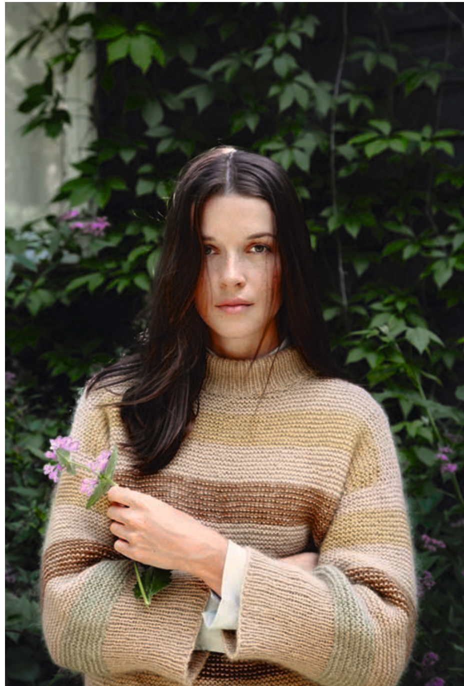
2013 | SUNDAY | X4 | 17 | 10 | • FAUNA GENSER 1 | TYNN SILK MOHAIR | XS-XXXL (nedenfra og opp)