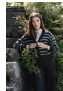
EMBLA STRIPEJAKKE Sunday x2 + Tynn Silk Mohair x2 Design 8