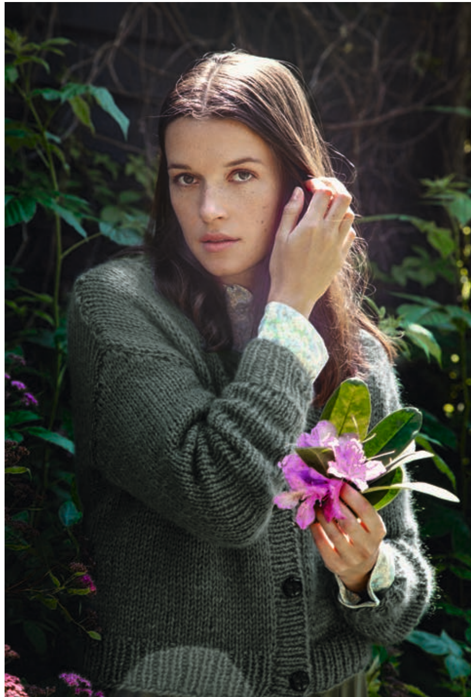
2013 | SUNDAY X2 | X9 | 12 110 | •• EMBLA JAKKE 6 | TYNN SILK MOHAIR X2 | XS-XXXL (nedenfra og opp)