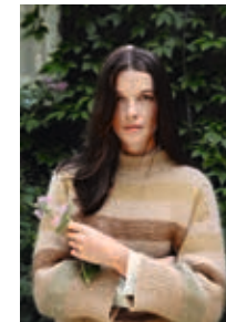
FAUNA GENSER Sunday + Tynn Silk Mohair Design 1