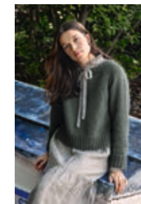
PIA GENSER Sunday + Tynn Silk Mohair Design 9