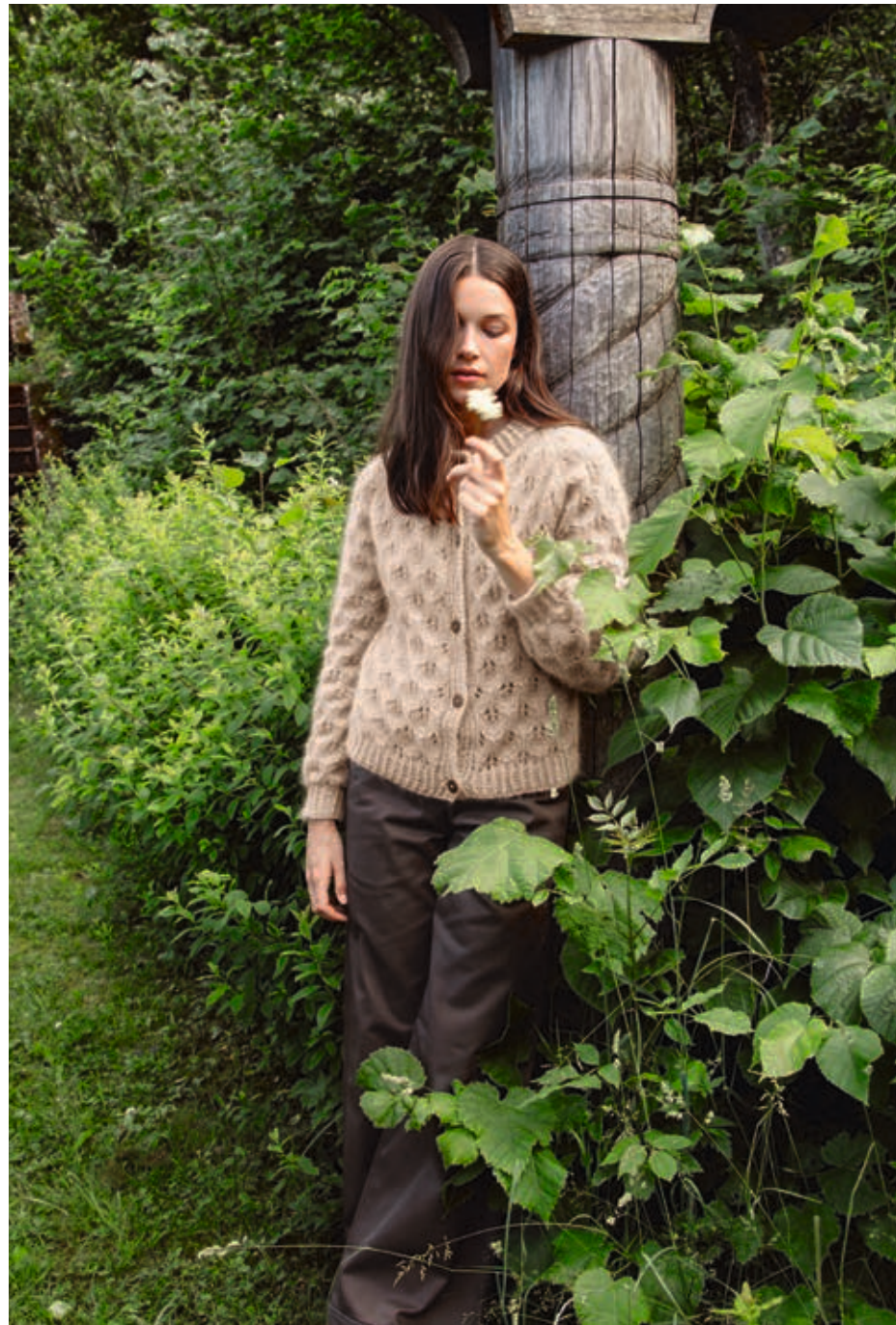
2013 | TYNN SILK MOHAIR X3 | \times 5\frac{1}{2} | \frac{16}{16} \frac{110}{110} | •• SNØKLOKKE JAKKE 4 | XS-XXXL (ovenfra og ned)