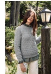
SPIRE GENSER Alpakka Silke + Silk Mohair Design 3