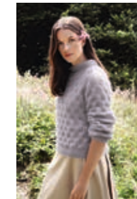
SNØKLOKKE GENSER Tynn Silk Mohair x3 Design 5