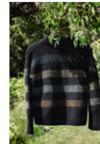
FAUNA GENSER Alpakka Silke + Tynn Silk Mohair Design 2