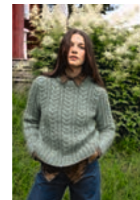
ALBA GENSER Kos + Tynn Silk Mohair Design 7