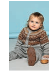
MARIUS DRESS Babyull Lanett Design 10