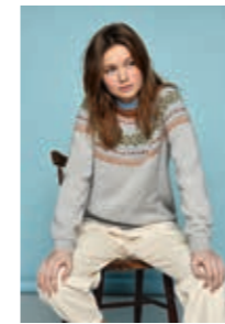
MARIUS DAMEGENSER Mini Alpaka Design 5