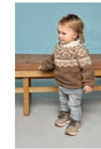
MARIUS BARNEGENSER Kos Design 2