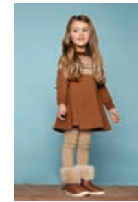
MARIUS KJOLE Tynn Merinoull Design 6