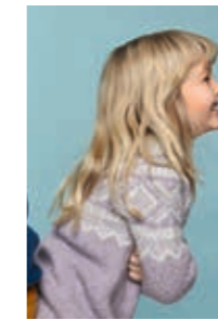
MARIUS BARNEGENSER Kos Design 2