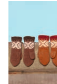
MARIUS DAMEVOTTER Fritidsgarn Design 8