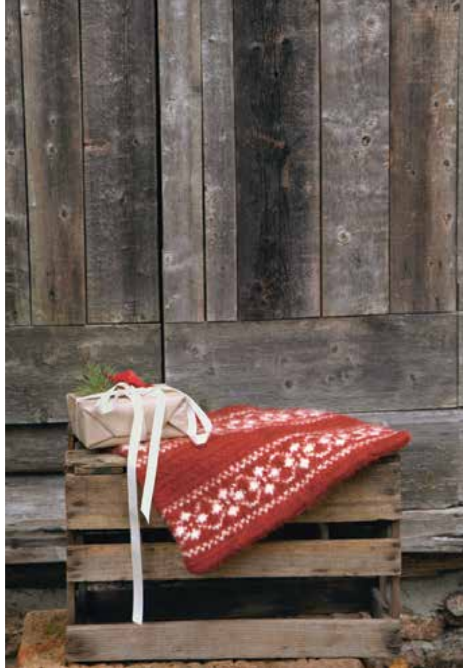
TEMA 66 | FRITIDSGARN | \times 5\frac{1}{2} | \frac{\wedge\wedge\wedge}{15|10} | •PUTTY SITTEUNDERLAG 2 | CA 44-35 CM