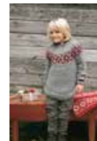
PUTTY BARN Design 1