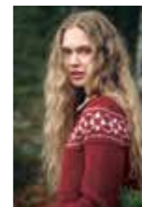
PUTTY DAME Design 4