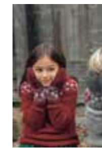
PUTTY VOTTER Design 5