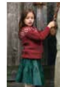
PUTTY BARN Design 1