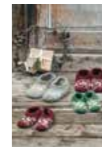
PUTTY TØFLER Design 6