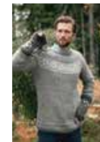
PUTTY HERRE Design 3