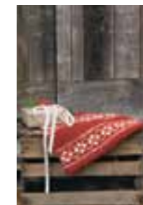
PUTTY SITTEUNDERLAG Design 2