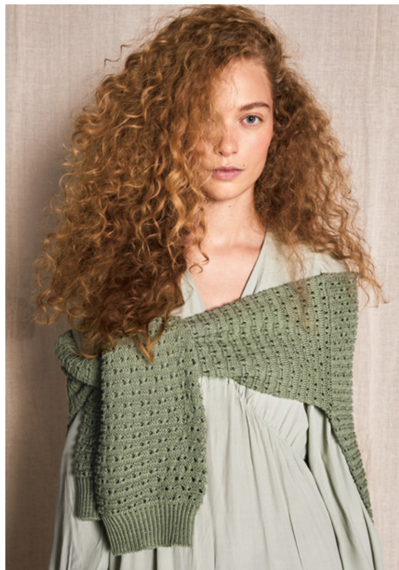
2204 | MANDARIN PETIT | 3 | 25 | 10 | JUNE GENSER 2 | XS - 4XL (ovenfra og ned)