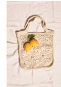
BUTTERCUP BAG Mandarin Petit x3 Design 3