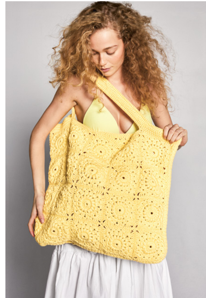
2204 | MANDARIN PETIT X3 | / 4½ | 15 | 10 | BUTTERCUP BEACHBAG 4 | 60 X 52 CM