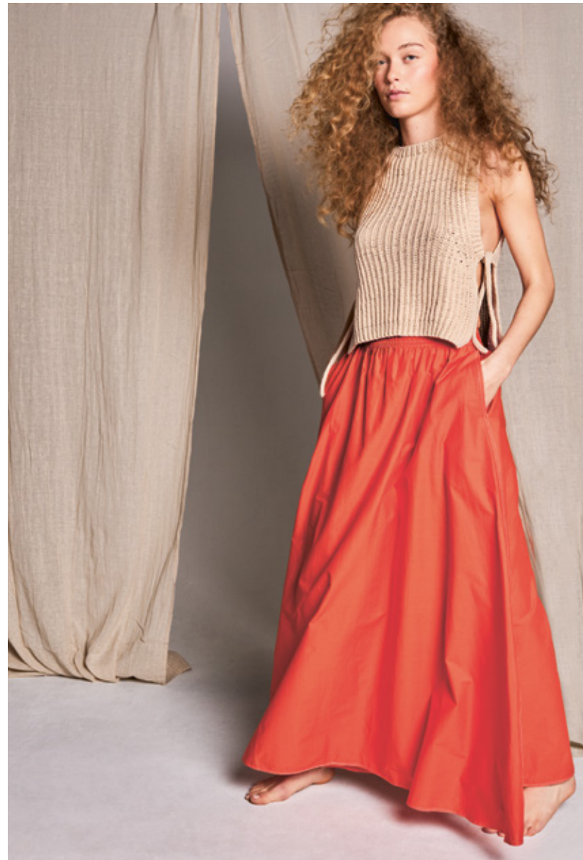
2204 | MANDARIN PETIT X2 | \times 3½ | \frac{17}{10} | ... HELLE SOMMERVEST 5 | XS - 3XL (nedenfra og opp)