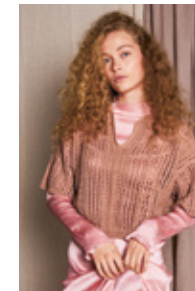
APRILBLUSE Mandarin Petit Design 1